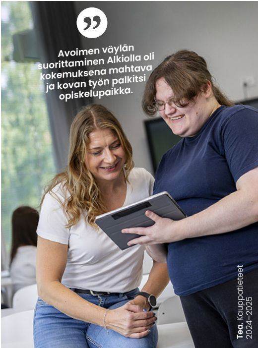
Tea, Kauppätieteet 2024–2025

Avoimen väylän suorittaminen Alkiolla oli kokemuksena mahtava ja kovan työn palkitsi opiskelupaikka.